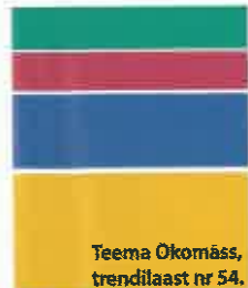
Teema Ökomäss, trendilaast nr 54.

Inspiratsiooni selleks saad ammutada Tikkurila uuest trendivärvide kollektsioonist 2012-2013. Tikkurila Feelingsi värvikollektsiooni kuulub 9 põnevat kombinatsiooni, näiteks Ökomäss, Väike romantika, Antwerpen, Juured ja Avameri. Uue kollektsiooniga saab tutvuda Tikkurila stendidel ehituskauplustes üle Eesti ja kodulehel www.tikkurila.ee