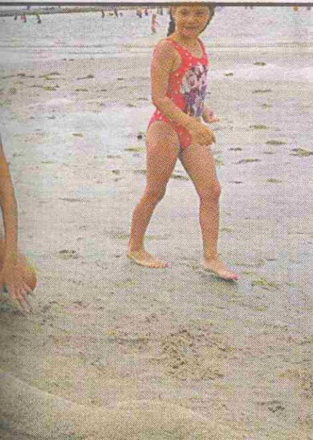
оны, клубные палатки в соответствующую