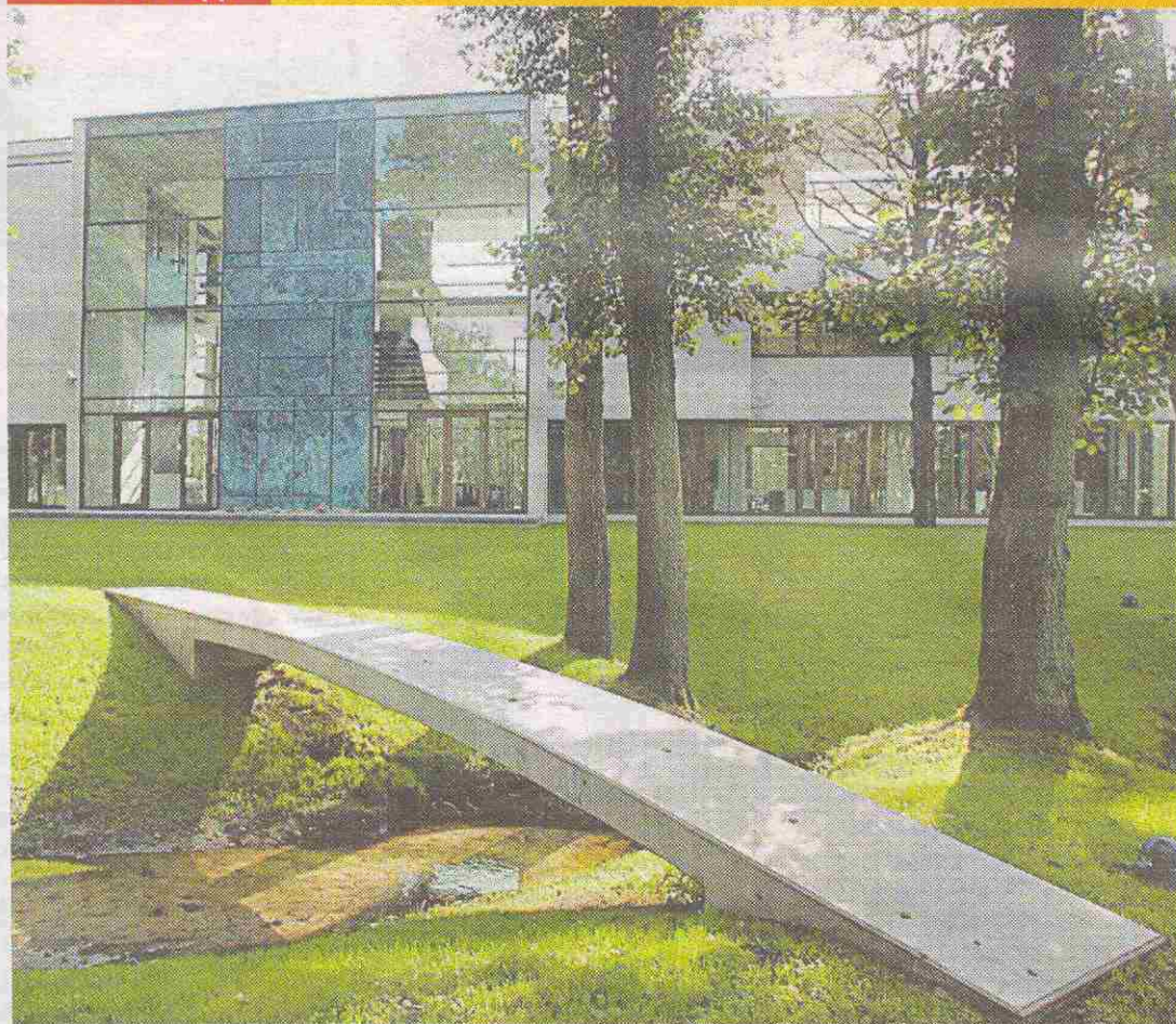
На конкурсе «Лучшее бетонное сооружение-2005» победило офисное здание на Мяхе теэ, 1, в Пирита. Архитектор Меэлис Пресс.