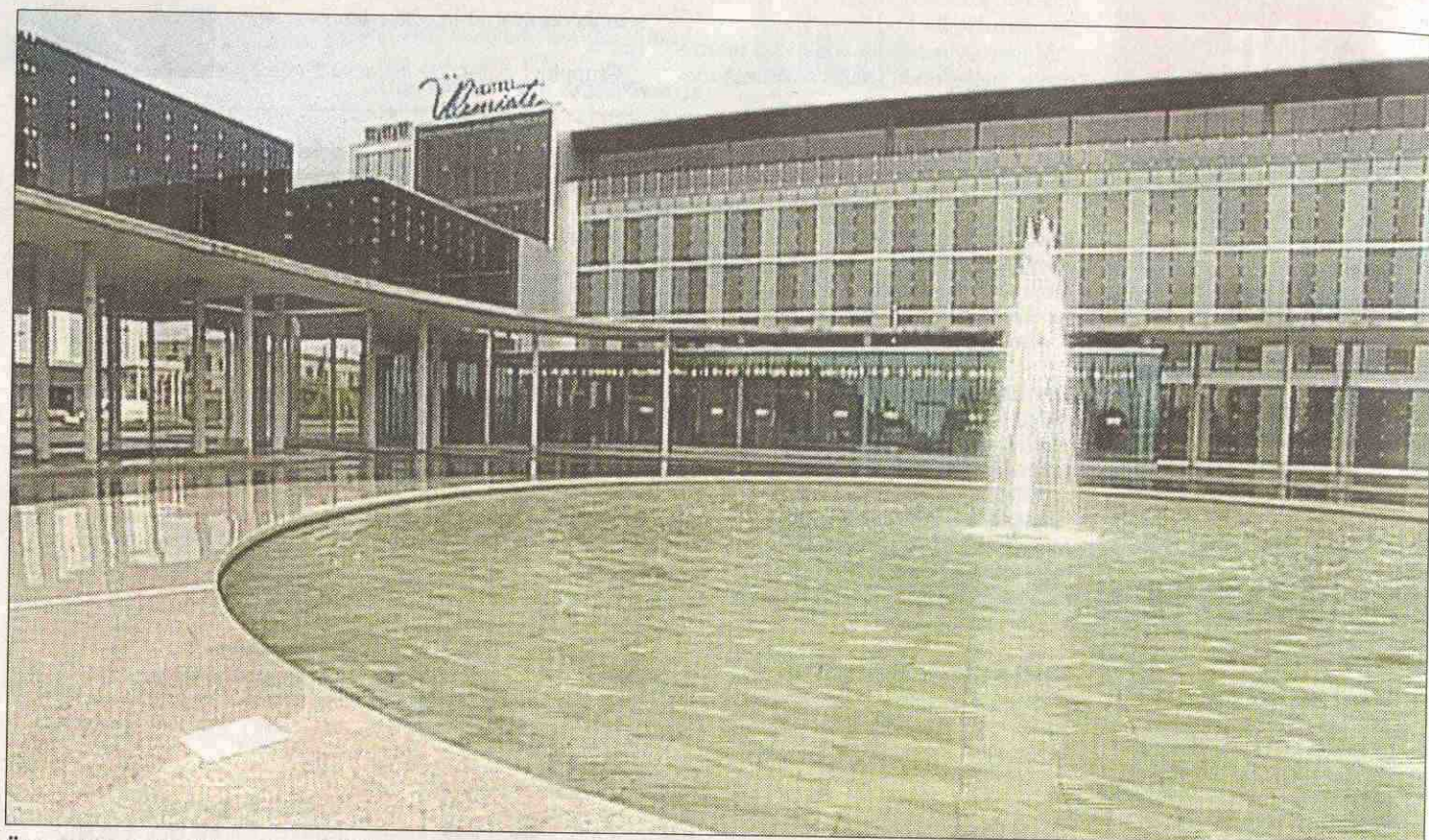
Ülemiste hotelli ehitusel kasutati betooni arhitektuurilistes lahendustes kui sisekujunduses.

Eesti Betooniühing ja Eesti Ehitusmaterjalide Tootjate Liit valisid 2004. aasta betoonehitiseks Ülemiste hotelli.