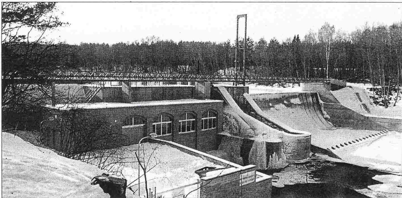
Projekteerija eriauhind läks Eesti Projektile Linnamäe hüdroelektrijaama taastamise eest. KAI ILUSTRUMM