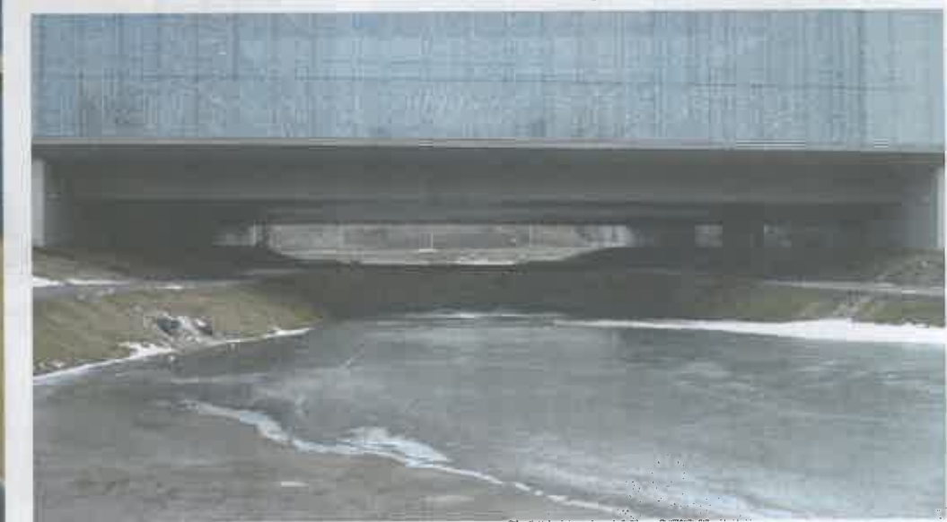
Aasta betoonehitus 2016 – Eesti Rahva Muuseum Tartus. Ühe põneva lahendusena annab sellele lennurada meenutavale pikale hoonele aktsendi selle alt läbi voolav vesi.