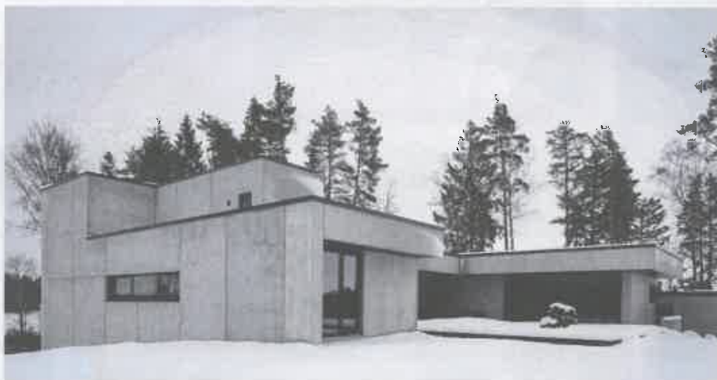
Villa Lääne-Virumaal on arhitektibüroo Emil Urbel OÜ loomung.