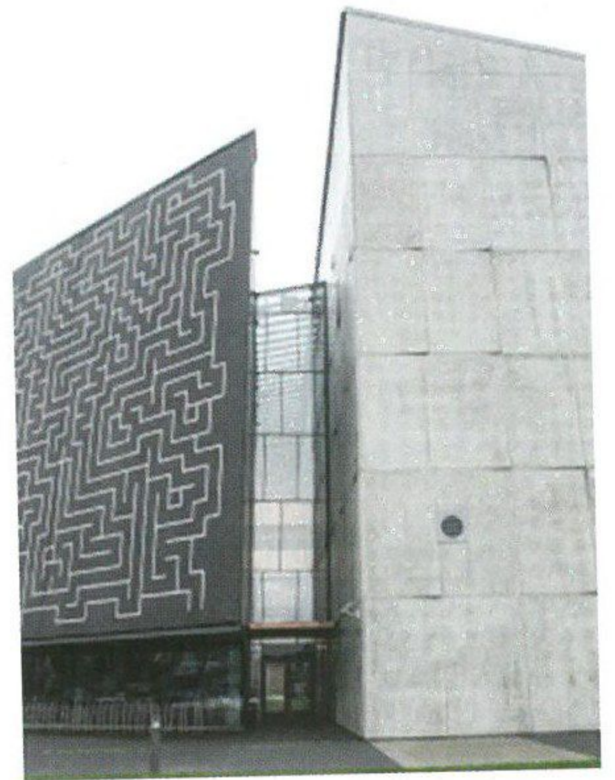
Rahvusarhiivi peahoone Noora

Seitsmeteistkümnendat korda korraldatava võistluse žüriisse kuuluvad Eesti Arhitektide Liidu, Eesti Betooni-