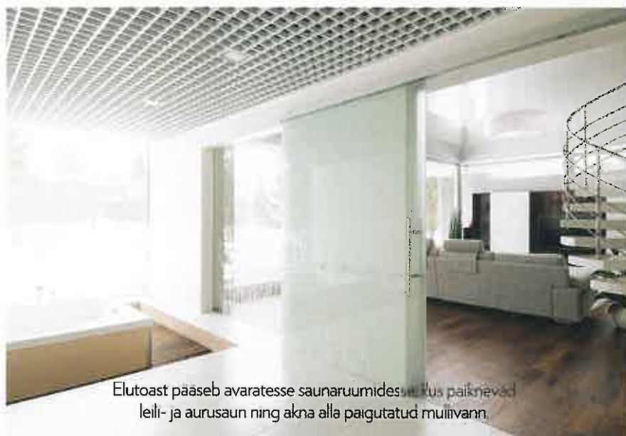
Elutoast pääseb avaratesse saunaruumidesse, kus paiknevad leili- ja aurusaun ning akna alla paigutatud multiivann.

Ühel meelel oldi selleski, et interjööri alustaladeks peavad saama avatus, valgus ja vaated. Rohked klaaspinnad toovad ruumidesse päevavalgust ja õhku enam kui küll. Efektselt mõjuvad suured ekraan- ja nurgaaknad. >