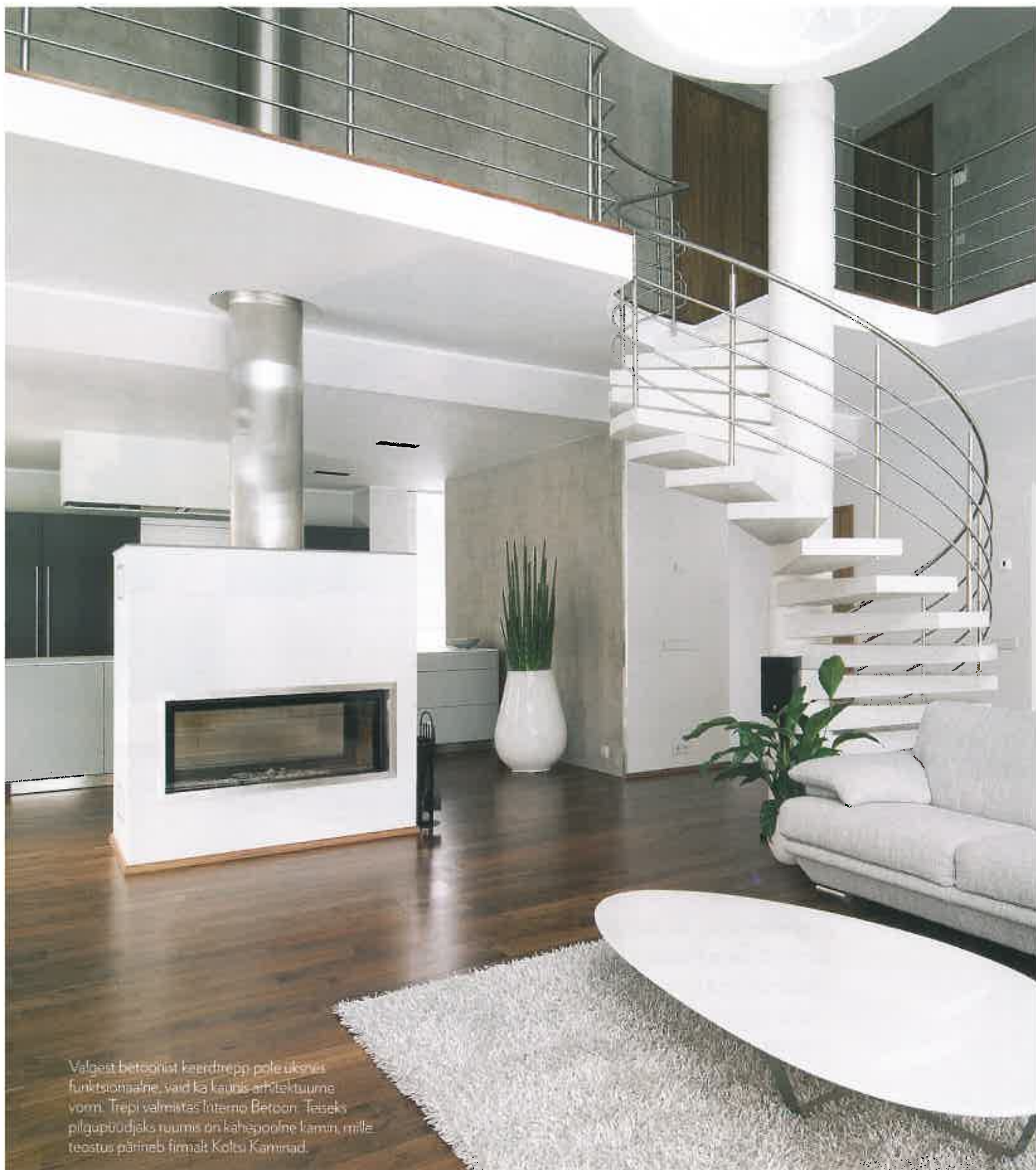
Valgeat betoonist keerdrepp pole uuevõit funktsionaalne, vaid ka launis arhitektuurne vorm. Trepi valmistas Interio Bercon. Teieks pilgupõudjaks ruumis on kahepoolne lamini, mille teostus pärineb firmalt Koltu Kamrad.