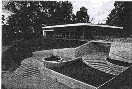
Центр помощи детям в Вильянди.

ровщик, строитель объекта-победителя, а также поставщик бетона.