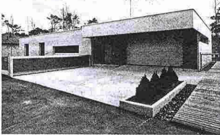
Индивидуальный дом в Нинанэме.