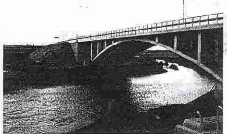
Мост в Пуурмани.