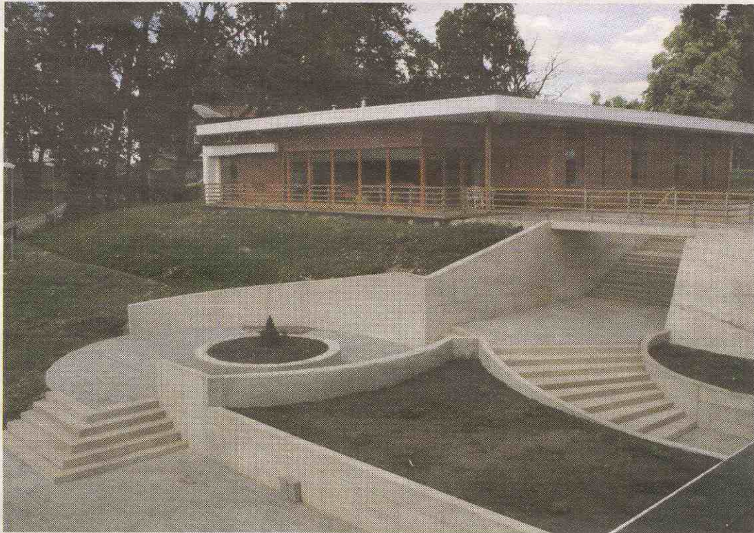
2007. aasta betoonehitise tiitlile kandideerivad omanäoline Viljandi lasteabikeskus (ülal), aga ka Puurmanni sild Jõgevamaal.

Hotelli omanikfirma ja YIT Ehituse vaidluse lahendas esmalt Kaubandus-Tööstuskoja arbitraažikohus, kes mõistis kahjusumma ehitusfirmalt välja. Mullu juunis tegi sama otsuse Tallinna ringkonnakohus,