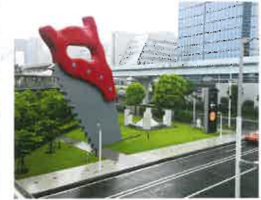
Skulptuur „SAAG” näitab ilmekalt jaapanlaste austust ehitusmeistrite ja käsitöölisedest meistrimeeste vastu. Hoolivus ja teistega arvestamine ning puhtus, puhtus, puhtus ...

et kõik, mis peeglist näha on, on Amaterasu ja kõikide teiste kamide kehastus.