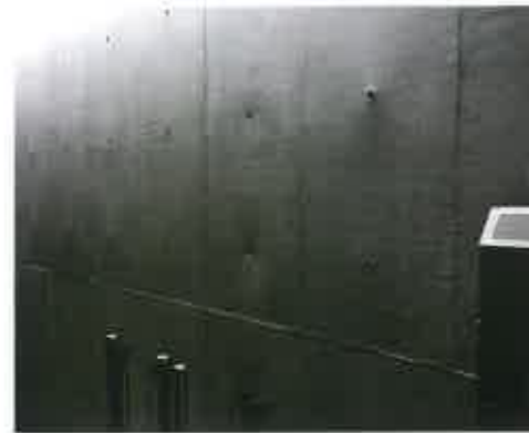
Järeltöötlemisel üldjuhul rõhutatakse, mitte ei peideta raketiste kilpide ja ühendustõmbide koonuste mustrit betoonpinnal.