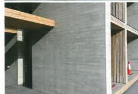
Puidutooni betoonpind Tokyos.

Jah, sametine betoon kõlab luksuslikult ja põnevalt ning olles ise toona selle juhendamaterjali loomise töörühmas, eeldasin, et selline pinnatöötlus on harvaesinev n-ö eksklusiivselt pidupäevalik, aga ei, see ongi Jaapanis igapäevaselt argine.