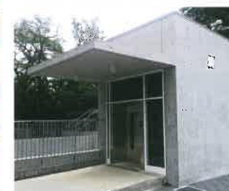
Töödeldud pinnad aia taga ülikoolilinnakus.