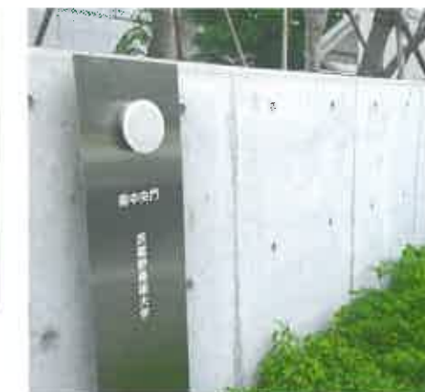
Puhasvalu pinnaga aed ülikoolilinnakus.