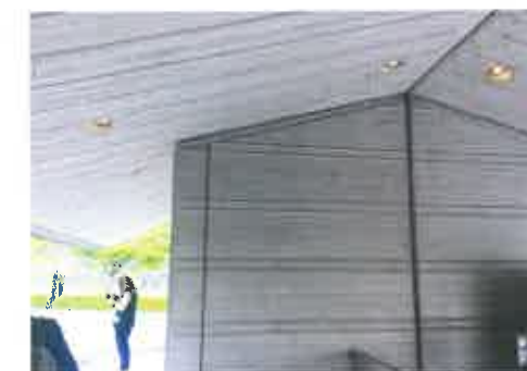
Sagawa kunstimuuseum, fotol kumab järeltöödeldud pinna alt läbi seinte raketiste tõmbide korrapärane samm, mida kohapeal keegi ei märganud.