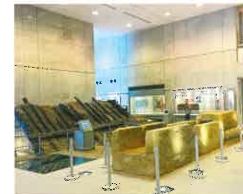
Sayamaike ajaloomuuseum Osakas. Tadao Ando 2001.