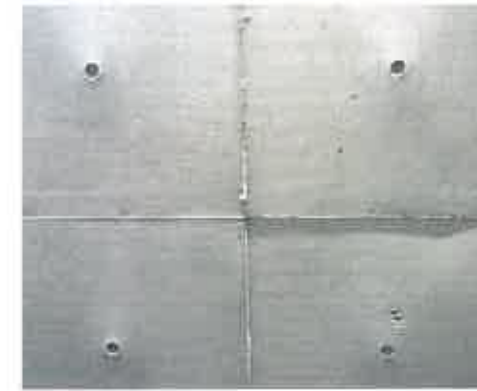
Kõige olulisem on raketiste kilpide hammas- ja ühendustõmbide koonuste muster betoonpinnal. Järeltöötlemise käigus üldjuhul seda rõhutatakse, mitte ei peideta.