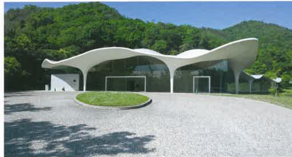
Ilmekas näide arhitekt Toyo Ito loodud krematooriumist Kakamigaharas 2006. aastal – looduse kuju järgides.