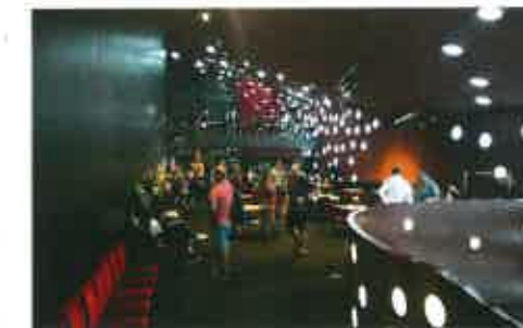
Toyo Ito 2008. aastal projekteeritud teatrihoone Tokyos.