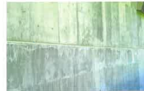
Toyo Ito loodud hoone mäepoolne sein on töönaoliselt taotluslikult „kirju”, justkui mäe kaevamise peegeldus.