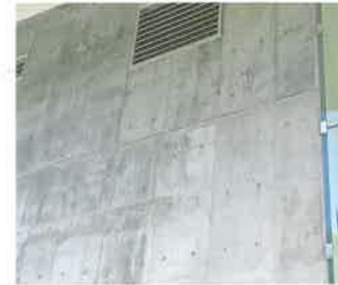
Krematooriumi küljesein. Siin on järeltöötlamine (viimistlemine) viidud klaaside juures lõpuni. Justkui inimese elu sünnist surmani, püüid täiuslikkuse poole. Raketise iga tahvel on klaaside suunas puhtama ja põhjalikuma pinnatöötusega.