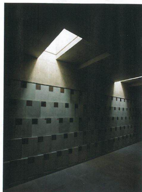
Tartu Pauluse kiriku kolumbaarium on esimene Eesti pühakojas asuv tuhaurnide hoidmise ruum.

Peaaühind kuulub võiduidea autorile. Ära märgitakse võitnud objekti tellija, projekteerija, ehitaja ja betooni tarnija.