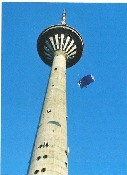
Möödunud aastal taasavatud Tallinna teletorn.

Konkursi eesmärgiks on leida ja esile tõsta ehitisi, mille nägusus ning efektiivne ja ökonoomne teostus demonstreerivad