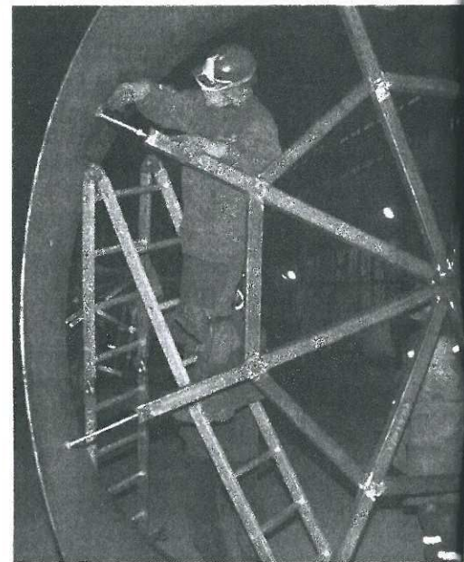
В заводских цехах.

По сути, завод стал промышленным парком, создает условия для старта новых фирм с самыми разнообразными сферами деятельности. Здесь на 30 гектарах территории развивают производство, помимо «Narva Bark», 22 фирмы-арендатора, в том числе по изготовлению металлоконструкций, швейных изделий и по ремонту техники. Например, таллинский завод «APL Production», специализирующийся на изготовлении сложных металлоконструкций, арендует на территории «Narva Bark» около девяти тысяч квадратных метров площадей и осваивает выпуск изделий для стран Евросоюза. По словам таллиннцев, нарвский завод предоставил удобную для развития производства инфраструктуру, достаточно высокая квалификация и у нарвитян, приглашенных на это производство.