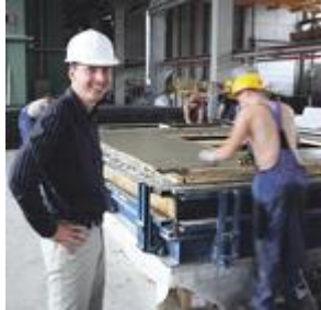
□ TMB Elementsi juht Juris Ka...

Ühena vähestest Eesti ettevõtetest Lätis tootmist arendava ASI Tartu Maja Betoontoodete tütarfirma TMB Elementsi tehas on vaid kahe aastaga väikseks jäänud ja firma plaanib võimsuse kahekordistamist.